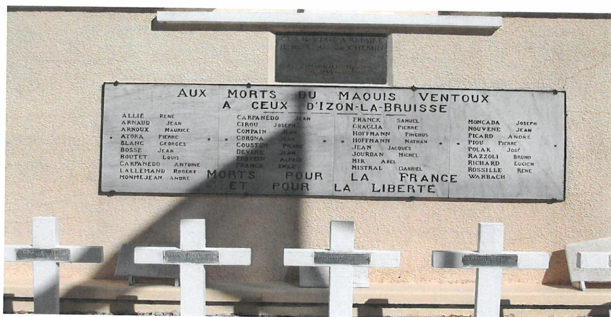
Stèle posée avant 1949 – Mémorial National.

Le 22 février 1944, Mardi-Gras, 4h30 du matin, un groupe soldats allemands, guidés par des Français, des traitres engagés dans l'armée allemande, investissent le territoire du Maquis Ventoux, plus communément appelé ici, Maquis d'Izon.